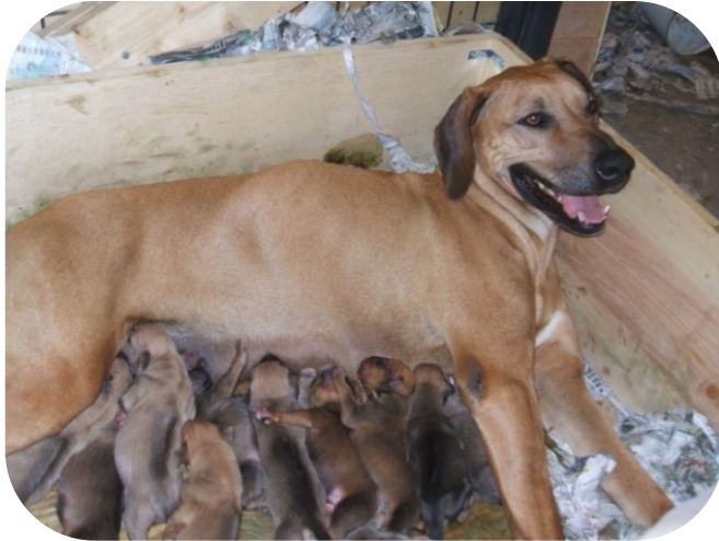
s'occupe de ses chiots